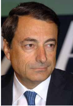
Mario Draghi President tal-Bord Ewropew dwar ir-Riskju Sistemiku

Għandi pjaċir nipprezenta t-tieni Rapport Annwali tal-Bord Ewropew dwar ir-Riskju Sistemiku (BERS) – il-korp indipendenti tal-Unjoni Ewropea (UE) li huwa responsabbli għas-sorveljanza makroprudenzjali tas-sistema finanzjarja tagħha. Il-Bank Ċentrali Ewropew (BĊE) jassiguralu s-Segretarjat u jipprovdi ukoll b'sostenn analitiku, statistiku, loġistiku u amministrattiv. Ir-rapport jagħti rendikont sħiħ tal-attivitajiet tal-BERS fit-tieni sena tal-eżistenza tiegħu. Din kienet sena ta' ħidma intensiva bil-ħsieb li jiġi stabbilit qafas makroprudenzjali solidu fl-Unjoni Ewropea filwaqt li jiġu identifikati u jittieħdu passi biex jittaffew ir-riskji sistemici fis-sistema finanzjarja tal-UE.