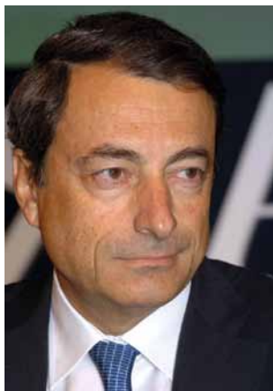
Mario Dragi Eiropas Sistēmisko risku kolēģijas priekšsēdētājs

Priecājos iepazīstināt ar otro gada pārskatu, ko sagatavojusi Eiropas Sistēmisko risku kolēģija (ESRK) – neatkarīga Eiropas Savienības (ES) struktūra, kura atbild par ES finanšu sistēmas makrouzraudzību un kurai Eiropas Centrālā banka (ECB) nodrošina Sekretariāta darbu un sniedz analītisku, statistikas, loģistikas un administratīvu atbalstu. Pārskats sniedz skaidru ieskatu par ESRK darbību tās otrajā pastāvēšanas gadā. Šo gadu raksturo spraigs darbs, kas vērsts uz stabilas makrouzraudzības sistēmas izveidi visā ES, identificējot sistēmiskos riskus, kas apdraud ES finanšu sistēmu, un veicot pasākumus, lai tos novērstu.