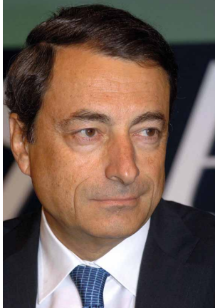
Mario Draghi ESRNi eesistuja

Mul on hea meel esitleda Euroopa Süsteemsete Riskide Nõukogu (ESRN) teist aastaaruannet. ESRN on Euroopa Liidu (EL) finantssüsteemi makrotasandi usaldatavusjärelvalve eest vastutav sõltumatu organ, kellele Euroopa Keskpank (EKP) tagab sekretariaaditeenused ning pakub tuge analüüsi, statistika, logistika ja halduse valdkonnas. Aruandes antakse tõene ülevaade ESRNi teisest tegevusaastast, mille jooksul on tehtud aktiivselt tööd makrotasandi usaldatavusjärelvalve töhusa raamistiku loomiseks ELis. Samal ajal on tuvastatud ELi finantssüsteemi stabiilsust ohustavaid süsteemseid riske ja võetud meetmeid nende mõju leevendamiseks.