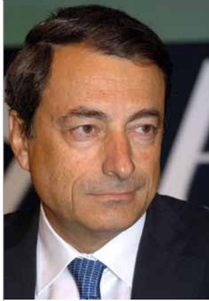
Mario Draghi Πρόεδρος του Ευρωπαϊκού Συμβουλίου Συστημικού Κινδύνου

Με ιδιαίτερη χαρά σας παρουσιάζω τη δεύτερη Ετήσια Έκθεση του Ευρωπαϊκού Συμβουλίου Συστημικού Κινδύνου (ΕΣΣΚ), το οποίο αποτελεί ανεξάρτητο όργανο της Ευρωπαϊκής Ένωσης (ΕΕ) και είναι αρμόδιο για τη μακροπροληπτική επίβλεψη του χρηματοπιστωτικού της συστήματος. Η Ευρωπαϊκή Κεντρική Τράπεζα (ΕΚΤ) διασφαλίζει τη γραμματειακή υποστήριξη του ΕΣΣΚ και το συνδράμει σε επίπεδο αναλύσεων, στατιστικών, καθώς και σε υλικοτεχνικό και διοικητικό επίπεδο. Η παρούσα έκθεση παρουσιάζει με έγκυρο τρόπο τις δραστηριότητες του ΕΣΣΚ κατά το δεύτερο έτος λειτουργίας του, στη διάρκεια του οποίου καταβλήθηκαν εντατικές προσπάθειες για τη θέσπιση ενός υγιούς μακροπροληπτικού πλαισίου στην ΕΕ και, παράλληλα, για τον εντοπισμό συστημικών κινδύνων που θα μπορούσαν να απειλήσουν το χρηματοπιστωτικό σύστημα της ΕΕ καθώς και τη λήψη μέτρων περιορισμού τέτοιων κινδύνων.