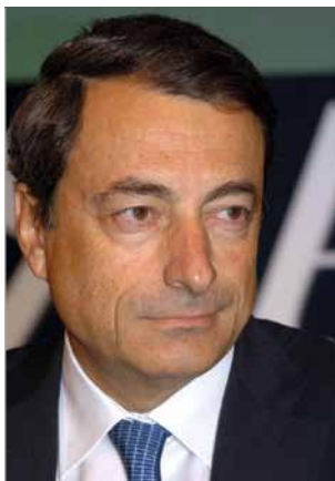
Mario Draghi Ordförande för Europeiska system- risknämnden

Jag har nöjet att presentera Europeiska systemrisknämndens (ESRB) andra årsrapport. ESRB är ett av Europeiska unionens (EU) oberoende organ med ansvar för makrotillsyn av det finansiella systemet på EU-nivå. Europeiska centralbanken (ECB) tillhandahåller ESRB:s sekretariat och lämnar analytiskt, statistiskt, logistiskt och administrativt stöd. Rapporten ger en noggrann redovisning av ESRB:s verksamhet under dess andra år. Det har varit ett år med intensivt arbete för att upprätta en sund makroprudentiell ram för hela EU och samtidigt identifiera och vidta åtgärder för att mildra systemrisker i EU:s finanssystem.