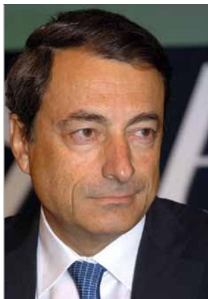
Mario Draghi Président du Comité européen du risque systémique

Je suis heureux de présenter le deuxième Rapport annuel du Comité européen du risque systémique (CERS), organe indépendant de l'Union européenne (UE) chargé de la surveillance macroprudentielle de son système financier. La Banque centrale européenne (BCE) assure le secrétariat du CERS et fournit un soutien analytique, statistique, logistique et administratif. Le rapport rend compte fidèlement des activités menées par le CERS au cours de sa deuxième année d'existence. Un travail intense a été effectué afin d'établir un cadre macroprudentiel solide à travers l'UE, tandis que des mesures ont été prises pour atténuer les risques systémiques identifiés dans le système financier de l'UE.