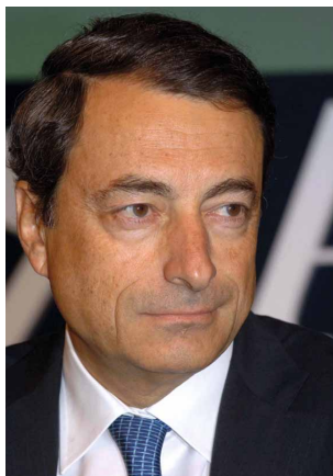
Mario Draghi předseda Evropské rady pro systémová rizika

S potěšením Vám předkládám druhou Výroční zprávu Evropské rady pro systémová rizika (ESRB), nezávislé instituce Evropské unie (EU) odpovědné za makrobezpečnostní dohled nad finančním systémem EU. Evropská centrální banka (ECB) zajišťuje ESRB činnost sekretariátu a poskytuje jí analytickou, statistickou, logistickou a administrativní podporu. Zpráva poskytuje věrný obraz činnosti ESRB během druhého roku její existence. Minulý rok byl ve znamení intenzivní činnosti zaměřené na vytvoření stabilního makrobezpečnostního rámce na úrovni celé EU, na identifikaci systémových rizik ve finančním systému EU a přijetí opatření na jejich zmírnění.