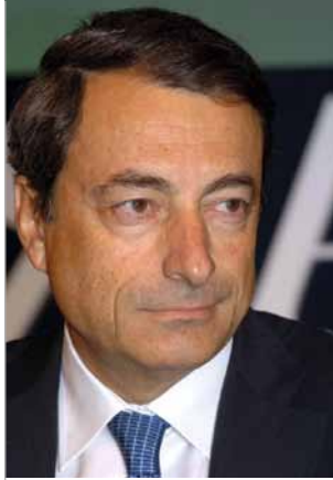
Mario Draghi predseda Európskeho výboru pre systémové riziká

S potešením predkladám druhú Výročnú správu Európskeho výboru pre systémové riziká (ESRB), nezávislého orgánu Európskej únie (EÚ) zodpovedného za makroprudenciálny dohľad nad finančným systémom EÚ. Európska centrálna banka (ECB) výboru ESRB zabezpečuje činnosti sekretariátu a poskytuje mu analytickú, štatistickú, logistickú a administratívnu podporu. Správa podáva verný obraz o činnosti ESRB počas druhého roku jeho existencie. Minulý rok sa niesol v znamení intenzívneho úsilia zameraného na vytvorenie pevného makroprudenciálneho rámca v celej EÚ, identifikáciu systémových rizík vo finančnom systéme EÚ a prijatie opatrení na ich zmiernenie.