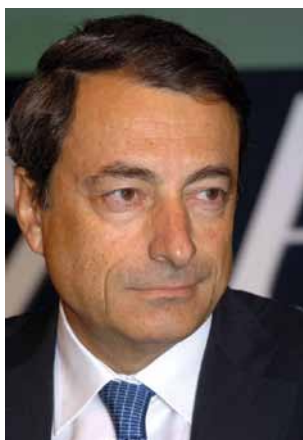
Mario Draghi Przewodniczący ERRS

Mam przyjemność przedstawić drugi Raport Roczny Europejskiej Rady ds. Ryzyka Systemowego (ERRS) – niezależnego organu Unii Europejskiej (UE) odpowiedzialnego za nadzór makroostrożnościowy nad unijnym systemem finansowym. Sekretariat ERRS jest prowadzony przez Europejski Bank Centralny (EBC), który zapewnia także wsparcie analityczne, statystyczne, logistyczne i administracyjne. Raport wiernie przedstawia działalność ERRS w drugim roku jej istnienia. Był to rok intensywnych prac zmierzających do wprowadzenia w całej UE solidnych zasad ramowych nadzoru makroostrożnościowego oraz działań w zakresie rozpoznania i łagodzenia ryzyka systemowego w unijnym systemie finansowym.