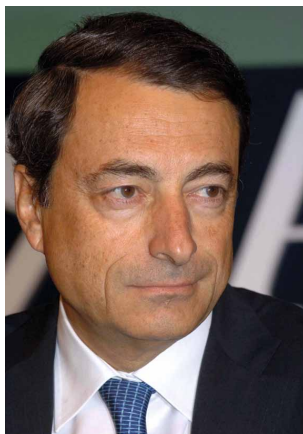
Mario Draghi Formand for Det Europæiske Udvalg for Systemiske Risici

Det glæder mig at præsentere den anden årsberetning fra Det Europæiske Udvalg for Systemiske Risici (ESRB). ESRB er et selvstændigt EU-organ med ansvar for det makroprudentielle tilsyn af det finansielle system i EU. ECB fungerer som sekretariat og bidrager med analytisk, statistisk, logistisk og administrativ støtte. Årsberetningen indeholder en grundig gennemgang af aktiviteterne for ESRB's andet arbejdsår, hvor der blev arbejdet intenst på at etablere en holdbar makroprudentiel ramme i EU, samtidig med at der blev afdækket systemiske risici i det finansielle system i EU og truffet foranstaltninger til at begrænse disse.