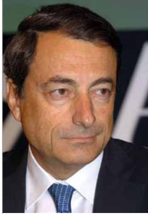
Марио Драги Председател на Европейския съвет за системен риск

Удоволствие за мен е да представя втория Годишен доклад на Европейския съвет за системен риск (ЕССР) – независим орган на Европейския съюз (ЕС), който отговаря за макропруденциалния надзор на финансовата система на ЕС и за който Европейската централна банка (ЕЦБ) осигурява секретариат, аналитична, статистическа, логистична и административна подкрепа. Докладът представя достоверно дейността на ЕССР през втората година от съществуването му. Това беше година на усилена работа, насочена към въвеждането на стабилна макропруденциална рамка в целия ЕС успоредно с идентифицирането на системните рискове във финансовата система на Съюза и действия за смекчаването им.