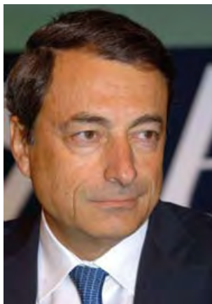
Mario Draghi predseda Európskeho výboru pre systémové riziká

S potešením vám predkladám prvú výročnú správu Európskeho výboru pre systémové riziká (European Systemic Risk Board – ESRB), ktorý bol zriadený v decembri 2010 ako nezávislý orgán Európskej únie (EÚ) zodpovedný za makroprudenciálny dohľad nad jej finančným systémom.