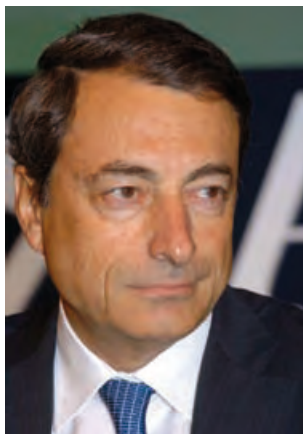
Mario Draghi Președintele Comitetului european pentru risc sistemic

Am plăcerea de a vă prezenta primul Raport anual al Comitetului european pentru risc sistemic (CERS), care a fost înființat, în luna decembrie 2010, ca organism independent al Uniunii Europene (UE), responsabil de supravegherea macroprudențială a sistemului financiar al Uniunii.