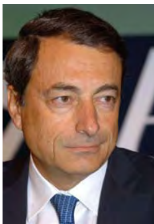
Mario Draghi Przewodniczący ERRS

Mam przyjemność przedstawić pierwszy Raport Roczny Europejskiej Rady ds. Ryzyka Systemowego (ERRS), utworzonej w grudniu 2010 r. jako niezależny organ Unii Europejskiej odpowiedzialny za nadzór makroostrożnościowy nad unijnym systemem finansowym.