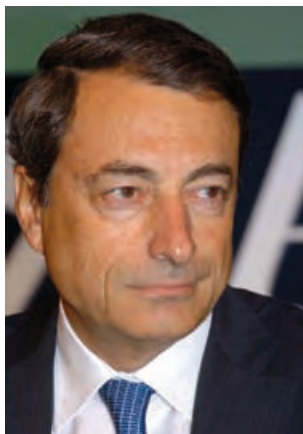
Mario Draghi ESRNi eesistuja

Mul on hea meel esitleda Euroopa Süsteemsete Riskide Nõukogu (ESRN) esimest aastaaruannet. ESRN loodi 2010. aasta detsembris Euroopa Liidu (EL) finantssüsteemi makrotasandi usaldatavusjärelevalve eest vastutava sõltumatu organina.