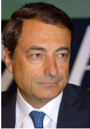
Mario Draghi Πρόεδρος του Ευρωπαϊκού Συμβουλίου Συστημικού Κινδύνου

Με ιδιαίτερη χαρά σας παρουσιάζω την πρώτη Ετήσια Έκθεση του Ευρωπαϊκού Συμβουλίου Συστημικού Κινδύνου (ΕΣΣΚ), το οποίο συστάθηκε τον Δεκέμβριο του 2010 ως ανεξάρτητο όργανο της Ευρωπαϊκής Ένωσης (ΕΕ) και είναι αρμόδιο για τη μακροπροληπτική επίβλεψη του χρηματοπιστωτικού της συστήματος.