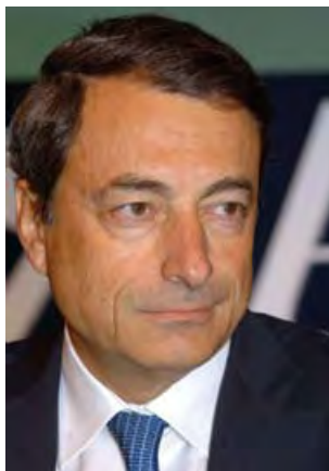
Mario Draghi Formand for Det Europæiske Udvalg for Systemiske Risici

Det glæder mig at præsentere Det Europæiske Udvalg for Systemiske Risici (ESRB) første årsberetning. ESRB blev oprettet i december 2010 som et uafhængigt EU-organ med ansvar for makrotilsynet med det finansielle system i EU.