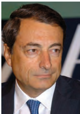
Mario Draghi Predsednik Evropskega odbora za sistemska tveganja

Z veseljem predstavljam prvo letno poročilo Evropskega odbora za sistemska tveganja (ESRB), ki je bil ustanovljen decembra 2010 kot neodvisen organ Evropske unije (EU), pristojen za makrobonitetni nadzor finančnega sistema.