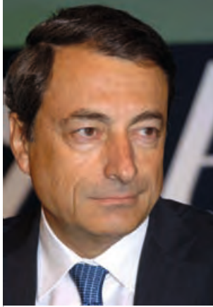
Mario Draghi President tal-Bord Ewropew dwar ir-Riskju Sistemiku

Hu ta' sodisfazzjon għaliya nipprezenta l-ewwel Rapport Annwali tal-Bord Ewropew dwar ir-Riskju Sistemiku (BERS) li twaqqaf f'Diċembru 2010 bħala korp indipendenti tal-Unjoni Ewropea (UE) responsabbli għas-sorveljanza makroprudenzjali tas-sistema finanzjarja tagħha.