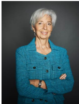
Christine Lagarde, predsednica Evropskega odbora za sistemska tveganja

Z velikim veseljem vam predstavljam dvanajsto letno poročilo Evropskega odbora za sistemska tveganja (ESRB), ki obravnava obdobje od 1. aprila 2022 do 31. marca 2023.