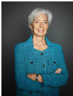
Europos sisteminės rizikos valdybos pirmininkė Christine Lagarde

Labai džiaugiuosi galėdama pristatyti dvyliktąją Europos sisteminės rizikos valdybos (ESRV) metų ataskaitą, apimančią laikotarpį nuo 2022 m. balandžio 1 d. iki 2023 m. kovo 31 d.