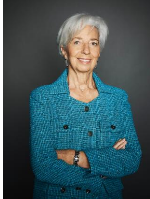
Christine Lagarde, Cathaoirleach an Bhoird Eorpaigh um Riosca Sistéamach

Tá an-áthas orm an 12ú Tuarascáil Bhliantúil ón mBord Eorpach um Riosca Sistéamach (BERS), a chlúdaíonn an tréimhse idir 1 Aibreán 2022 agus 31 Márta 2023, a chur i láthair. Is cuid thábhachtach de thrédhearcacht agus de chreat cuntasachta BERS í an tuarascáil. Leis an tuarascáil seo, atá dírithe ar chomhreachtóirí san Aontas Eorpach agus ar phobal na hEorpa i gcoitinne, mínimid cén chaoi ar chomhlíon BERS a sainordú.