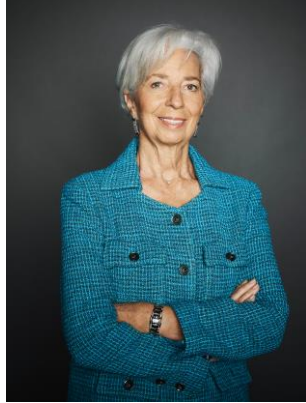
Christine Lagarde, Euroopan järjestelmäriskikomitean puheenjohtaja

Euroopan järjestelmäriskikomitean (EJRK) 12. vuosikertomus kattaa ajanjakson 1.4.2022–31.3.2023. Vuosikertomuksessa kerrotaan avoimuuden ja tilivelvollisuuden periaatteiden mukaisesti EU:n lainsäätäjille ja muille eurooppalaisille, miten EJRK hoiti tehtävänsä tuona aikana.