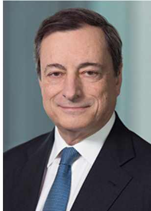
Mario Draghi, Euroopa Süsteemsete Riskide Nõukogu eesistuja

Euroopa Süsteemsete Riskide Nõukogu (ESRN) seitsmes aastaaruanne hõlmab ajavahemikku 1. aprillist 2017 kuni 31. märtsini 2018. Vaatlusalusel ajavahemikul jätkas ESRN Euroopa finantssüsteemi ja majanduse süsteemse riski allikate tähelepanelikku jälgimist ning tuvastas neli peamist riski, mis Euroopa Liidu (EL) finantsstabiilsust ohustavad. ESRN analüüsis oma töö käigus arengut ärikinnisvara sektoris ja pangandussektorivälises finantssektoris.