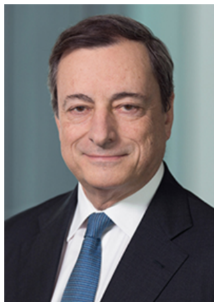
Mario Draghi, Voorzitter van het Europees Comité voor Systeemrisico's

In de loop van 2015 is het Europees Comité voor Systeemrisico's (European Systemic Risk Board of ESRB) de mogelijke bronnen van systeemrisico's in het Europese financiële stelsel en de economie nauwlettend blijven volgen. Er waren bij tijd en wijle tekenen van een verslechtering van kwetsbaarheden op drie terreinen. Er was bovenal sprake van aanzienlijke marktvolatiliteit, die werd veroorzaakt door ontwikkelingen in belangrijke opkomende markteconomieën in het najaar van 2015 en die zich snel uitbreidde naar de mondiale financiële markten, waaronder de Europese. Het ESRB was alert op het risico van herprijzing van risico's in de mondiale financiële markten en verhoogde in reactie op deze ontwikkelingen dit risico naar de hoogste categorie. Begin 2016 deden deze kwetsbaarheden zich deels ook daadwerkelijk voor in een klimaat dat werd gekenmerkt door aanhoudende onzekerheid over het mondiale economische herstel, door voortdurende zwaktes in de balansen van banken en verzekeraars in de EU, en door een