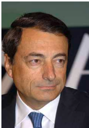
Mario Draghi President tal-Bord Ewropew dwar ir-Riskju Sistemiku

Dan huwa r-raba' Rapport Annwali tal-Bord Ewropew dwar ir-Riskju Sistemiku (BERS), li jkopri l-perjodu bejn l-1 ta' April 2014 u l-31 ta' Marzu 2015. Bid-dhul fis-seħħ tal-legiżlazzjoni l-ġdida tal-UE dwar l-attivitajiet bankarji (CRD IV/CRR), dan huwa wkoll l-ewwel perjodu li fih l-awtoritajiet makroprudenzjali kellhom il-possibbiltà li jagħmlu użu diskrezzjonali mill-għodod makroprudenzjali fl-Unjoni Ewropea. Il-BERS kellu sehem importanti billi rakkomanda li jitwaqqfu l-awtoritajiet nazzjonali, u ssuġġerixxa li għandu jingħatalhom mandat politiku ċar u sħiħ u li għandhom ifasslu strateġiji biex iħejju għal azzjoni politika meta din tkun meħtieġa. L-ewwel fażi tat-twaqqif tal-politika makroprudenzjali fl-Ewropa għalhekk issa ntemmet. Għad baqa' biss f'tit Stati Membri li m'għaddewx din il-legiżlazzjoni u nixtieq inhegġiġhom iwettqu r-rakkomandazzjonijiet tal-BERS.