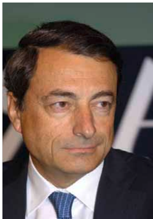
Mario Draghi Formand for Det Europæiske Udvalg for Systemiske Risici

Dette er den fjerde årsberetning fra Det Europæiske Udvalg for Systemiske Risici (ESRB). Beretningen dækker perioden 1. april 2014 til 31. marts 2015. Med ikrafttrædelsen af den nye EU-lovgivning på bankområdet (CRD IV/CRR) er det samtidig den første periode, hvor de makroprudentielle myndigheder selv har haft mulighed for at bestemme anvendelsen af makroprudentielle værktøjer i Den Europæiske Union. ESRB spillede en central rolle ved at henstille til, at der blev etableret nationale myndigheder, og stille forslag om, at myndighederne skulle udstyres med et klart og fuldstændigt politisk mandat, og at de desuden skulle udarbejde strategier for at forberede politiske foranstaltninger, der vil kunne anvendes, hvis det er nødvendigt. Den første fase af indførelsen af makroprudentielle politikker i Europa er således afsluttet. Kun få medlemslande har endnu ikke vedtaget en sådan lovgivning, og jeg vil gerne opfordre dem til at følge op på ESRB's henstillinger.